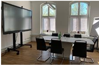
Tagungsraum mit Smartboard