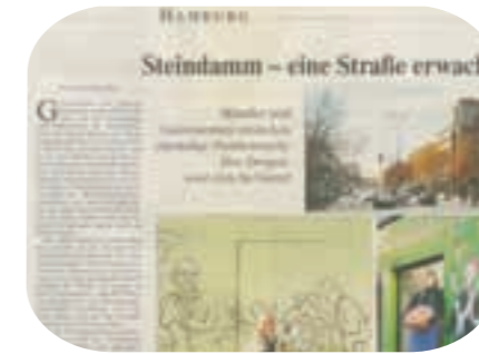
Die Welt, 29.11.2007