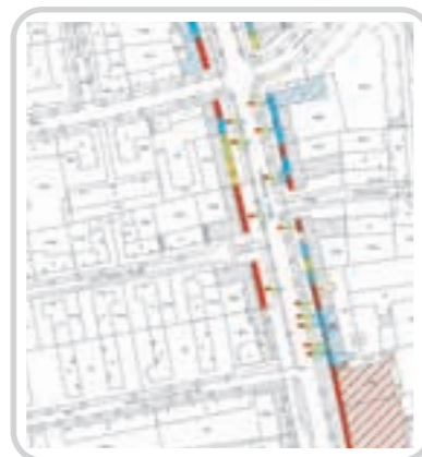
Kartierung der Branchen entlang der Fuhle

Davon können auch Investoren profitieren. Henze: „Wenn in dem neu entstehenden Quartier 21 auf dem Gelände des ehemaligen Barmbeker Krankenhauses Gewerbe integriert werden soll, ist eine vorherige Analyse des Gewerbekatalogs sicher aufschlussreich.“