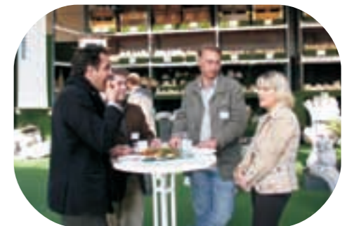
Kontaktbörse für Unternehmen: „Insel-Dialog“

Die von LoWi organisierten „Insel-Dialoge“ dienen Betrieben auf den Elbinseln als Forum. Und durch die Kooperation mit der IBA wird die lokale Ökonomie in zukünftige Entwicklungen eingebunden.