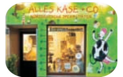
Alles Käse, Ellmenreichstr. 28: Rollt der Käse, rollt der Taler

Mit ihrem kleinen Laden „Alles Käse“ weckt Isolde Werner Neugierde: Durch ein erlesenes Angebot, eine leuchtende Geschäftsfassade, durch Presseberichte und durch ihre persönliche Präsenz im Stadtteil. Um mehr Kunden auf ihr Geschäft aufmerksam zu machen, wurde mit Unterstützung des Europäischen Sozialfonds (ESF) eine Marketingpostkarte erstellt, die in Hotels ausliegt. Zweisprachig preist sie norddeutsche Spezialitäten an. So werden nun auch internationale Gäste und Touristen angesprochen. Demnächst soll der Aufbau eines Firmen-Caterings folgen.