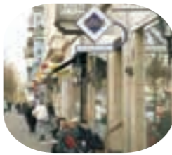
Geschäfte im Reiherstiegviertel

teilwirtschaft wünschenswert. Zwei gewerbliche Netzwerke konnten installiert werden – hier stehen nun Wachstum und Stabilisierung an. Unser Ziel für Wilhelmsburg: Die IG Reiherstieg wird beim Wachstum unterstützt. Sie soll zentraler Akteur im Reiherstieg werden. Die „Insel-Dialoge“ wollen wir als