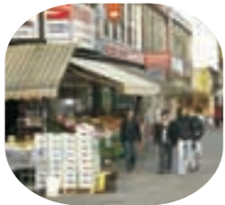
Lokale Ökonomie am Steindamm

St. Georg ist durch ein hochkomplexes Geflecht unterschiedlicher Teilökonomien geprägt. Ob wohnortnahe Versorgung, Produkte aus aller Welt oder Hotels – wir wollen unsere Erfahrungen für die qualitative Weiterentwicklung der einzelbetrieblichen Interessen und netzwerkorientierten Strukturen einbringen. Das Ziel in St. Georg: In Abstimmung mit Akteuren der Quartiersentwicklung und durch eine Kooperation mit „Unternehmer ohne Grenzen“ sollen gewerbliche Netzwerke entwickelt und etabliert werden, die ihrerseits die Entwicklung der Stadtteile positiv beeinflussen.