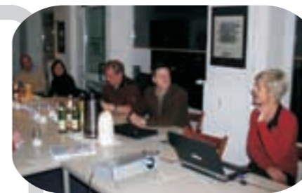
IG-Sitzung 13.11.07: Die IBA stellt sich vor